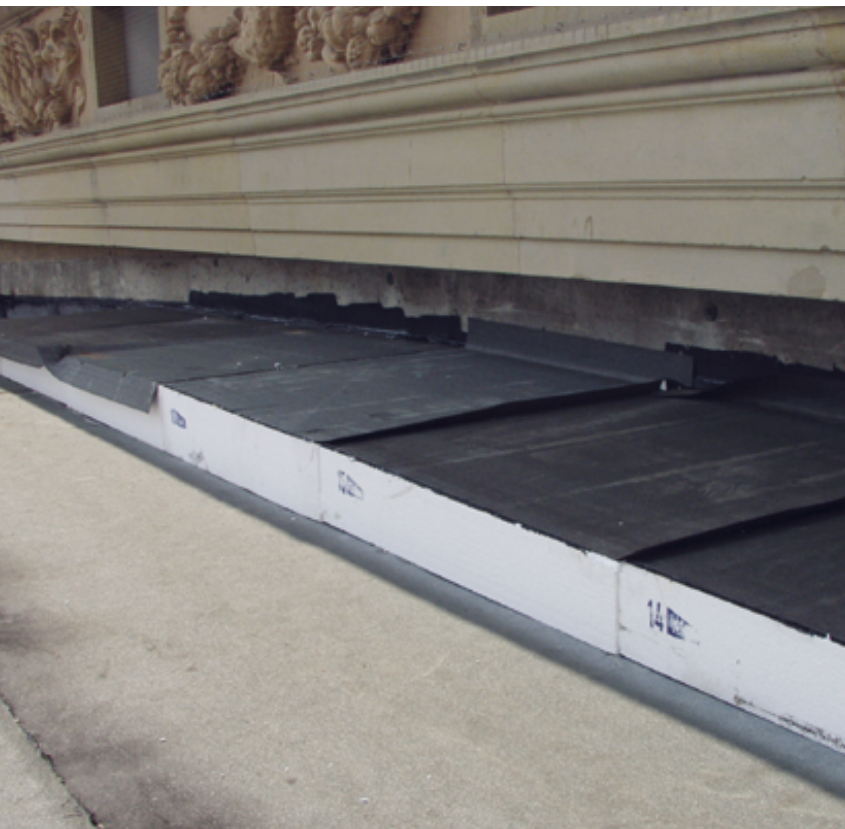
Dampfsperre mit darüberliegender Gefälle-Wärmedämmung.