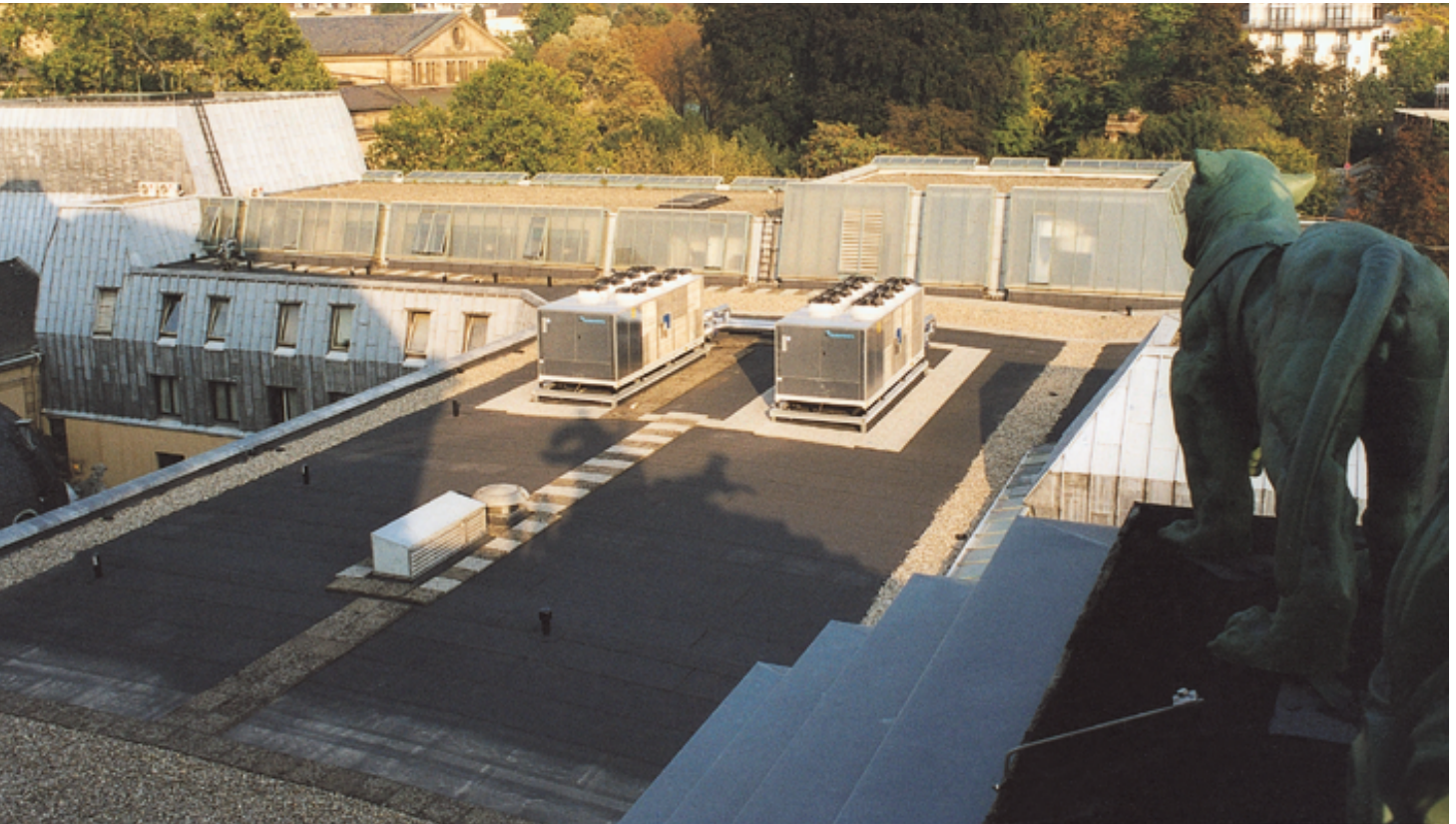
Die titangraue beschieferte Oberlagsbahn sorgt für eine Dachfläche, die sich sehen lassen kann.