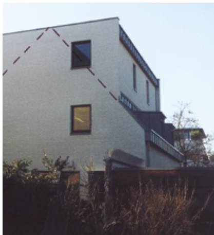
Auf- bzw. Umbau eines Satteldaches zu einem Flachdach und dadurch Schaffung weiteren Raumes.

In Großstädten, Ballungsräumen und Universitätsstädten ist Wohnraum in den vergangenen Jahren zunehmend knapp geworden. Mit Aufstockungen auf bestehenden Gebäuden können neue Wohnflächen hinzugewonnen werden.