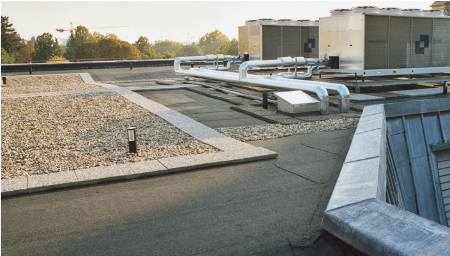
Das fertige Dach kommt ohne zusätzlichen Oberflächenschutz aus. Lediglich dort, wo der Brandschutz es erfordert, ist Kies aufgebracht.

Für das notwendige 2 %-Gefälle sorgt nun die auf der Dampfsperre verlegte Gefälle-Wärmedämmung mit einem Verlauf von 210 Millimeter Stärke in der Dachmitte und 130 Millimeter am Rand. Durch die Verlegung einer zweilagigen Abdichtung aus Polymerbitumenbahnen oberhalb der Dämmung entstand aus dem Umkehrdach ein Warmdach.