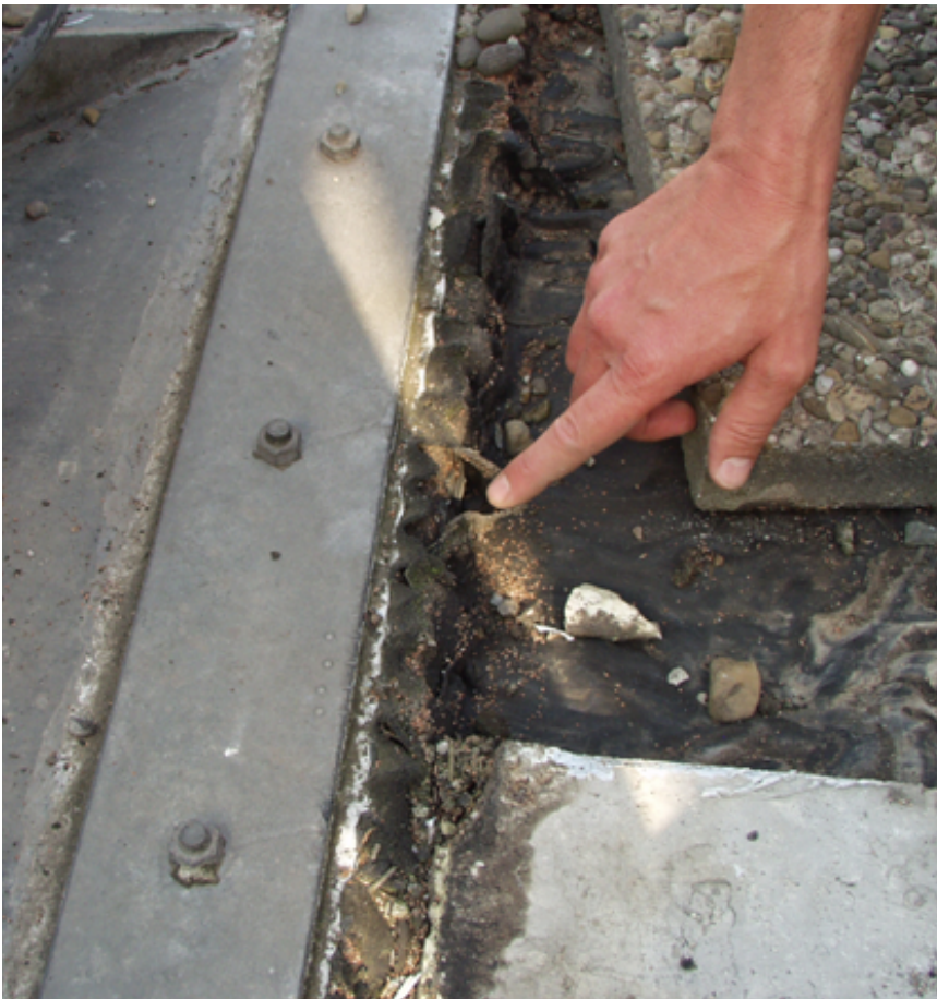
Die gute Verträglichkeit von Bitumenbahnen mit anderen Materialien macht die fachgerechte Sanierung leichter – und sicher.

Bitumenbahnen können auf vielen Materialien zur Abdichtung verwendet werden.