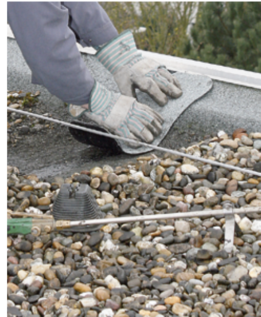
Kleine Schäden lassen sich in der Regel schnell beheben, wodurch die Funktionsfähigkeit der Dachabdichtung erhalten bleibt.

Mit Bitumenbahnen können auch einzelne Fehlstellen ausgebessert werden.