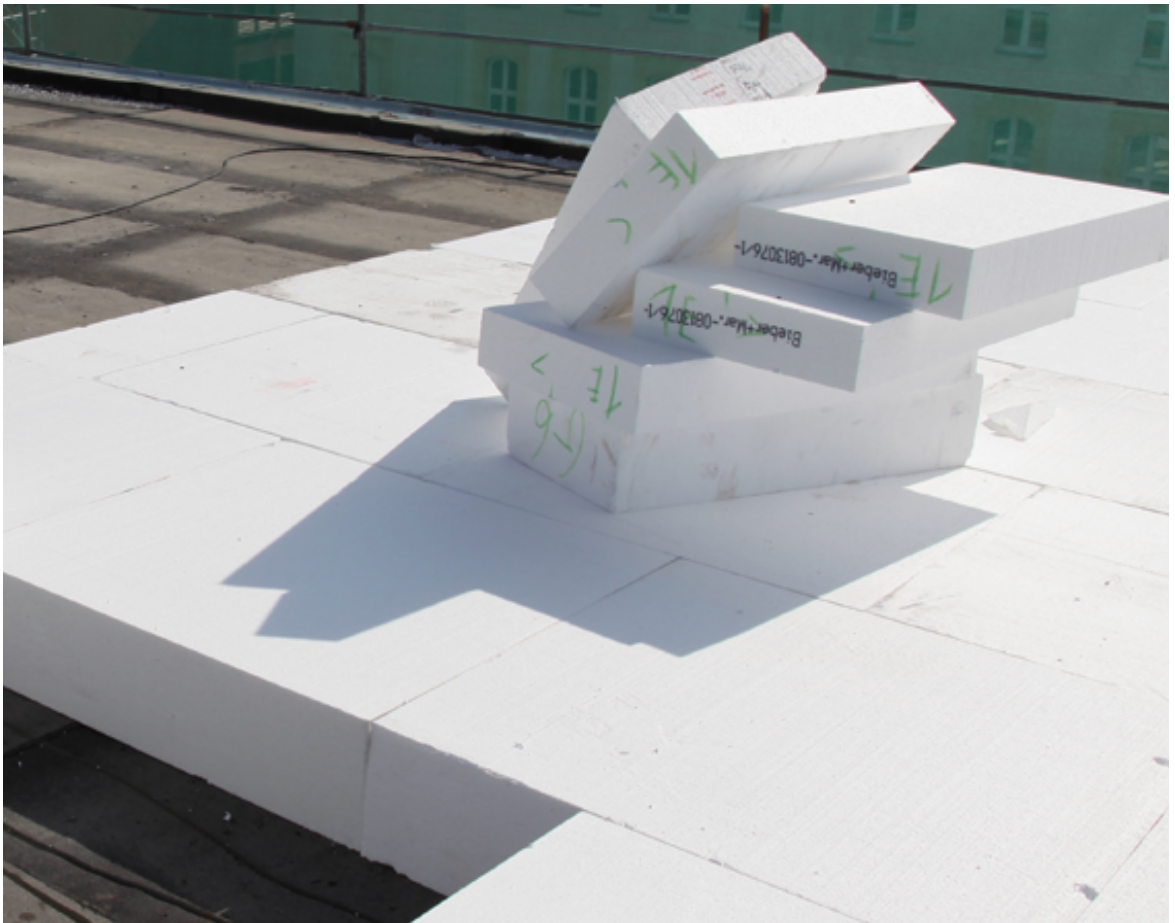
Mit der richtigen Dachabdichtung Heizkosten sparen: Bitumenbahnen schützen auch die Dämmung dauerhaft vor mechanischen und klimatischen Beanspruchungen, damit diese ihren Zweck erfüllen kann.

Der ökologische Aspekt ist – auch bedingt durch die in der Energieeinsparverordnung festgelegten gesetzlichen Bestimmungen – einer der häufigsten Gründe für eine energetische Sanierung. Bitumenbahnen sind hier aufgrund ihrer robusten und langlebigen Eigenschaften oftmals die erste Wahl beim Abdichtungsmaterial. Denn Bitumenbahnen halten ein Dach über viele Jahre hinweg dauerhaft dicht. Damit schützen sie auch die Dämmung vor äußeren Einflüssen – und damit auch deren einwandfreie Funktion. So trägt auch eine hochwertige Dachabdichtung dazu bei, dass Heizkosten gesenkt und die gesetzlichen Klimaschutzvorgaben dauerhaft eingehalten werden.