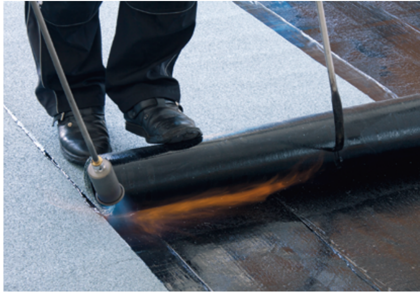
Das fachgerechte Verschweißen der Oberlagsbahn aus Elastomerbitumen sorgt dafür, dass die Oberfläche bei Wind und Wetter sicher dicht bleibt.

Zeitgleich mit den Abbrucharbeiten am Dach des mittleren Gebäudes begannen auch die Sanierungsarbeiten auf den beiden Seitenflügeln des Gebäudes. Über dem vorhandenen Warmdachaufbau mit einlagiger Bitumenabdichtung wurde hier zunächst ein Bitumenvoranstrich aufgebracht und dann abschließend eine neue Oberlage aus Polymerbitumen aufgebracht. Die Bahn ist auf ihrer Unterseite mit Therm-Streifen ausgestattet, die eine unterbrochen streifenweise Verklebung ermöglichen. „Der damit dauerhaft gewährleistete Dampfdruckausgleich sorgt dafür, eventuell vorhandene Feuchtigkeit aus dem alten Dachaufbau zu verteilen“, erklärt Timo Berner.