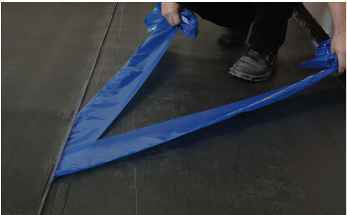
Einfache Verarbeitung: Elastomerbitumen-Kaltselbstklebebahnen sind nicht nur sehr einfach zu verlegen, sie sind außerdem besonders gut als untere Lage der Abdichtung geeignet.

Um auch während der Sanierungsarbeiten des rund 1.100 Quadratmeter großen Mitteldaches eine durchgehend wasserdichte Konstruktion zu erhalten, wurden in mehreren Schritten jeweils kleinere Abschnitte der alten Holz-Unterkonstruktion abgebrochen, um auf den betreffenden Bereichen dann sogleich eine neue Dampfsperre auftragen zu können. „Nach der Fertigstellung sämtlicher Abbrucharbeiten konnte dann entsprechend des Aufbaus als Warmdach mit dem Verlegen der Wärmedämmung aus EPS begonnen werden“, erklärt Projektleiter Timo Berner. Als weitere Maßnahme wurde entsprechend der Brandschutzauflagen ein 1,20 Meter breiter Brandschutzriegel aus nicht brennbarem, mit Vlies kaschierter Mineralfaser-Gefälledämmung mit einem Flammpunkt von über 1.000 Grad Celsius eingefügt und mit dem Untergrund verklebt. Direkt darüber wurde dann als erste Abdichtungslage eine Elastomerbitumen-Kaltselbstklebebahn vollflächig verlegt, bevor abschließend eine Oberlagsbahn aus Elastomerbitumen aufgeschweißt werden konnte . Parallel dazu erfolgte auch der Anschluss an die aufgehenden Bauteile sowie an die vorgehängte Dachrinne.