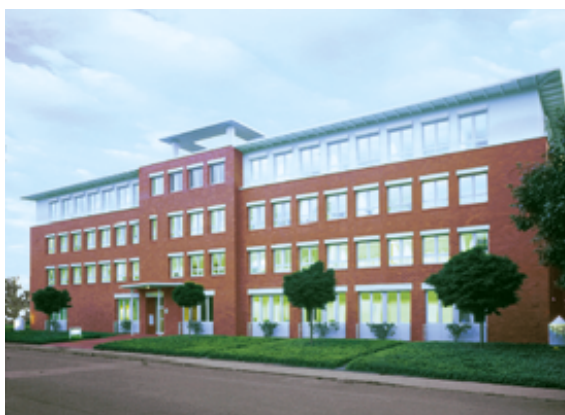
Vorher, nachher: Durch eine Dachaufstockung kann hochwertiger Wohnraum geschaffen werden.